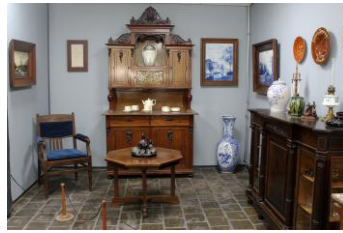
5. Huizinga Kabinet, stijlkamer met Nederlandse kunstnijverheid 1900-1940; meubels van Groninger meubelfabriek Huizinga