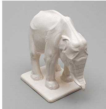
7. Zaal 2. Expo Nederlandse keramiekplastieken en fabrieken van Rozenburg, PZH, Distel, Goedewaagen Holland-Utrecht en Noordwijk. Middenin pioniers Nederlandse kunstglazuren: Mauser, Lanooij, Verlee en Nienhuis