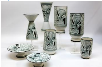
3. Gang tussenhal; Rechts tableaux C. De Bruin, tableaux ENKK, Kampen; tegels PBD en Distel; Links expo PZH Retro ca 1960