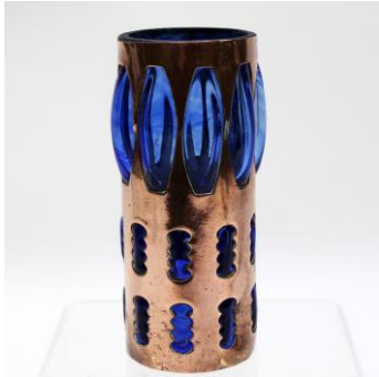
2. In entreegang - Glaswerk uit de Drents-Groninger Veenkoloniën, lamp G. Nanninga 140 topstukken uit collectie Brans