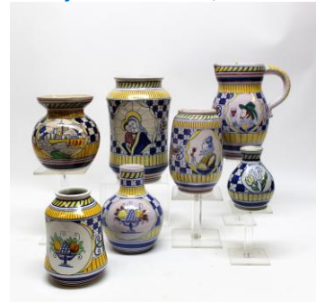
11. Nieuw in Goedewaagen-gang: Goedewaagendesign 1923 – 2020