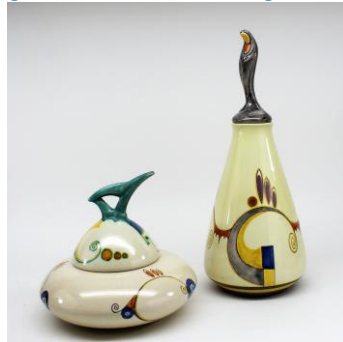
6. Zaal 1, linka af in gang tussenhal: expositie Art Deco in Velsler aardewerk, 1920-1932