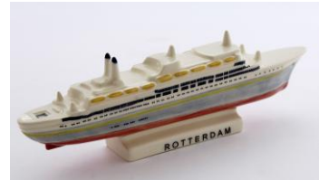
10. Gang met miniatures en HAL-edities; voorin vitriines met middeleeuwse beerput vondsten en majolica 1550-1650, Tichelaar.